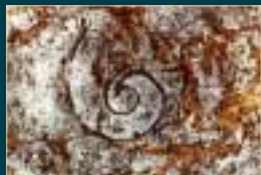
A gastropod fossil. Un fossile de gastropode.