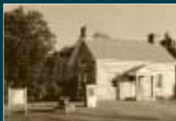
Isle La Motte Public Free Library. Bibliothèque publique de l'île La Motte.

L'île La Motte est le plus grand site fossile de l'histoire de la formation du Chazy Reef, le plus ancien récif à abriter des coraux au monde. Il a été formé pendant la période Ordovicienne, il y a environ 450-480 millions, dans une mer tropicale chevauchant l'équateur.