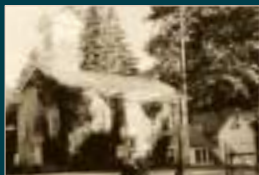
Isle La Motte Methodist Church. Église Méthodiste de l'île La Motte.