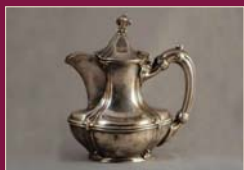
Hotel Teapot. Théière de l'hôtel.

Le 26 mai 1910, l'hôtel a brûlé. Il a été reconstruit l'année suivante comme structure de 200 chambres en acier et béton. Le krach boursier de 1929 a marqué le début de la fin de l'ère des hôtels de luxe. En 1951, la propriété est devenue le Bellarmine College, un séminaire des Jésuites qui a été en service jusqu'en 1967. Deux ans plus tard, le Clinton Community College a ouvert ses portes à 189 étudiants à temps plein.