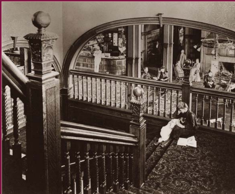
Landing of Hotel Champlain. La jetée de l'hôtel Champlain.

On May 26, 1910, the hotel burned. It was rebuilt the next year as a 200-room, steel and concrete structure. The stock market crash of 1929 marked the beginning of the end of the luxury hotel era. In 1951, the property became Bellarmine College, a Jesuit seminary that operated until 1967. Two years later Clinton Community College opened its doors to 189 full-time students.