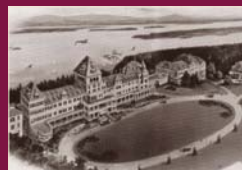
"Hotel Champlain, Bluff Point Near Plattsburgh" promotional pamphlet c. 1906/ Special Collections, Feinberg Library, SUNY at Plattsburgh. Brochure de promotion de l'hôtel Champlain, Bluff Point près de Plattsburgh c. 1906/Collections spéciales, bibliothèque Feinberg, SUNY à Plattsburgh.