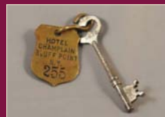
Hotel Room Key. Clé de chambre d'hôtel.