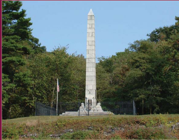
A 50-foot granite obelisk monument erected on Crab Island commemorating the naval victory./Priscilla R. Hammond. Une croix mortuaire de granite de 15,24 m (50 pi) érigée sur l'île Crab rappelant la victoire navale./Priscilla R. Hammond.

The guns raged for almost three hours before the British lowered their colors and surrendered. On Crab Island the hospital was soon overwhelmed as the casualties arrived. And, amidst the carnage, an estimated 150 British and American soldiers and sailors were simply buried in shallow unmarked and now lost graves, their final resting places. In 1908, a 50-foot granite obelisk was erected on the island to commemorate "One of the Most Decisive American Land and Naval Victories of the War."