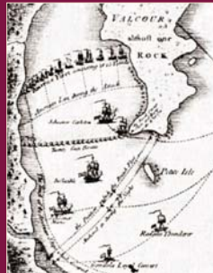
Battle of Valcour/The North American Atlas Wm. Faden, London 1777/Library of Congress. Battle of Valcour/The North American Atlas Wm. Faden, London 1777/Library of Congress.