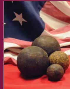
Cannon balls recovered from Champlain Valley/Courtesy of the Clinton County Historical Association Museum. Boudets de canon récupérés de la Vallée Champlain/Courtoisie du Clinton County Historical Association Museum.