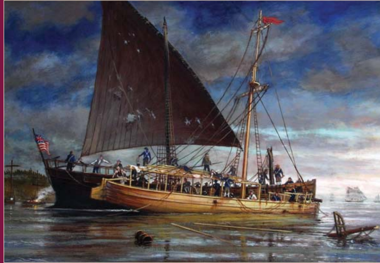
"Sinking of the Philadelphia" by Ernest Haas, courtesy of the Lake Champlain Maritime Museum, lamm.org. Le naufrage du Philadelphia d'Ernest Haas, courtoisie du Lake Champlain Maritime Museum, lamm.org.

In 1935, Colonel Lorenzo F. Hagglund found and raised the American gondola, the Philadelphia , from the Valcour Channel. In 1964, the Philadelphia was restored and placed on permanent display at the Smithsonian's National Museum of American History.