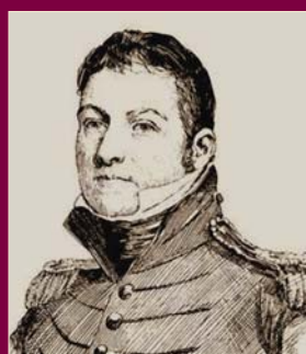
General George Izard was one of the best trained officers in the War of 1812 having been educated at military and engineering schools. He was in charge of land forces protecting Lake Champlain in 1814 until ordered to reinforce the Army of Niagara. After the war he became governor of the Arkansas territory, where Izard County is named after him.