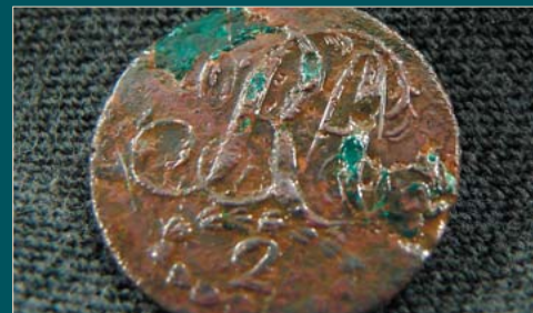
Coat button of the 2nd Regiment of Artillery, US Regulars, circa 1813 recovered in excavations of Camp Burlington burial grounds. Bouton de manteau du 2e Régiment de l'artillerie, Réguliers-US, circa 1813, retrouvé aux fouilles du terrain où se trouvent les tombes militaires sans marque du cantonnement de Burlington.