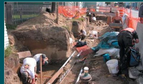
Since 2002, the University of Vermont's Consulting Archeology Program has conducted excavations of the burial ground related to the War of 1812. Depuis 2002, le Consulting Archeology Program de l'Université du Vermont mènent des fouilles du site où furent enterrés les victimes associées à la Guerre de 1812.