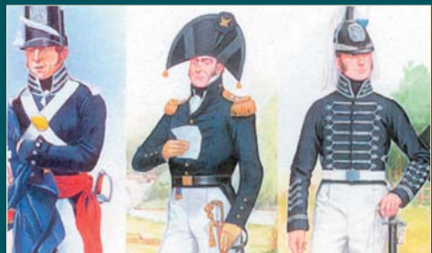
Examples of American uniforms probably seen in Burlington during the War of 1812. Tenues militaires exemplaires de l'époque et probablement portés à Burlington durant la Guerre de 1812.