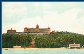
The Hotel Champlain, as seen from Lake Champlain in the early 1900s. Guests staying at this luxurious hotel often made their way to the Island for recreational purposes. It burned in 1910 and was replaced by a similarly sized structure, which today houses the Clinton Community College.

Blessed with unique natural and geological features, hiking, camping, kayaking, and wildlife viewing are all popular activities on the island. A great blue heron rookery located on the southeastern portion is one of the largest in the northeast.