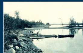
Twin Bays on Valcour Island, circa 1908. (Published by Arthur Livingston, NY, No. 1195.)

"Baby Blues," une scène qu'on retrouve à l'île Valcour. (Tableau de Nancy Howe, East Dorset, VT.)