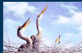
"Baby Blues," similar to scenes found on Valcour Island. (Painting by Nancy Howe, East Dorset, VT.)

L'île Valcour a été colonisée après la Révolution américaine. Des maisons y furent construites et, dans la partie nord, une ferme fut aménagée. En 1963, l'État de New York commença à acheter des terres sur l'île et la dernière parcelle privée fut acquise en 1984. L'île Valcour est aujourd'hui l'expression de la sensibilisation croissante du public à la conservation de l'une des magnifiques zones naturelles de l'État de New York.