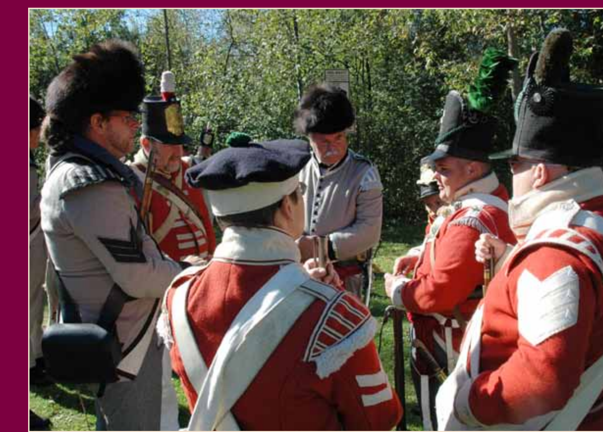
British soldiers in casual conversation. The British army (red uniforms) included the East Kent Regiment known as the 3rd Buffs, as well as the Canadian Voltigeurs (gray uniforms).

“Le livre pictorial de la guerre de 1812” de John Benson Lossing, 1868. Collections spéciales, Librairie Benjamin F. Fennberg, State University of New York at Plattsburgh, NY.