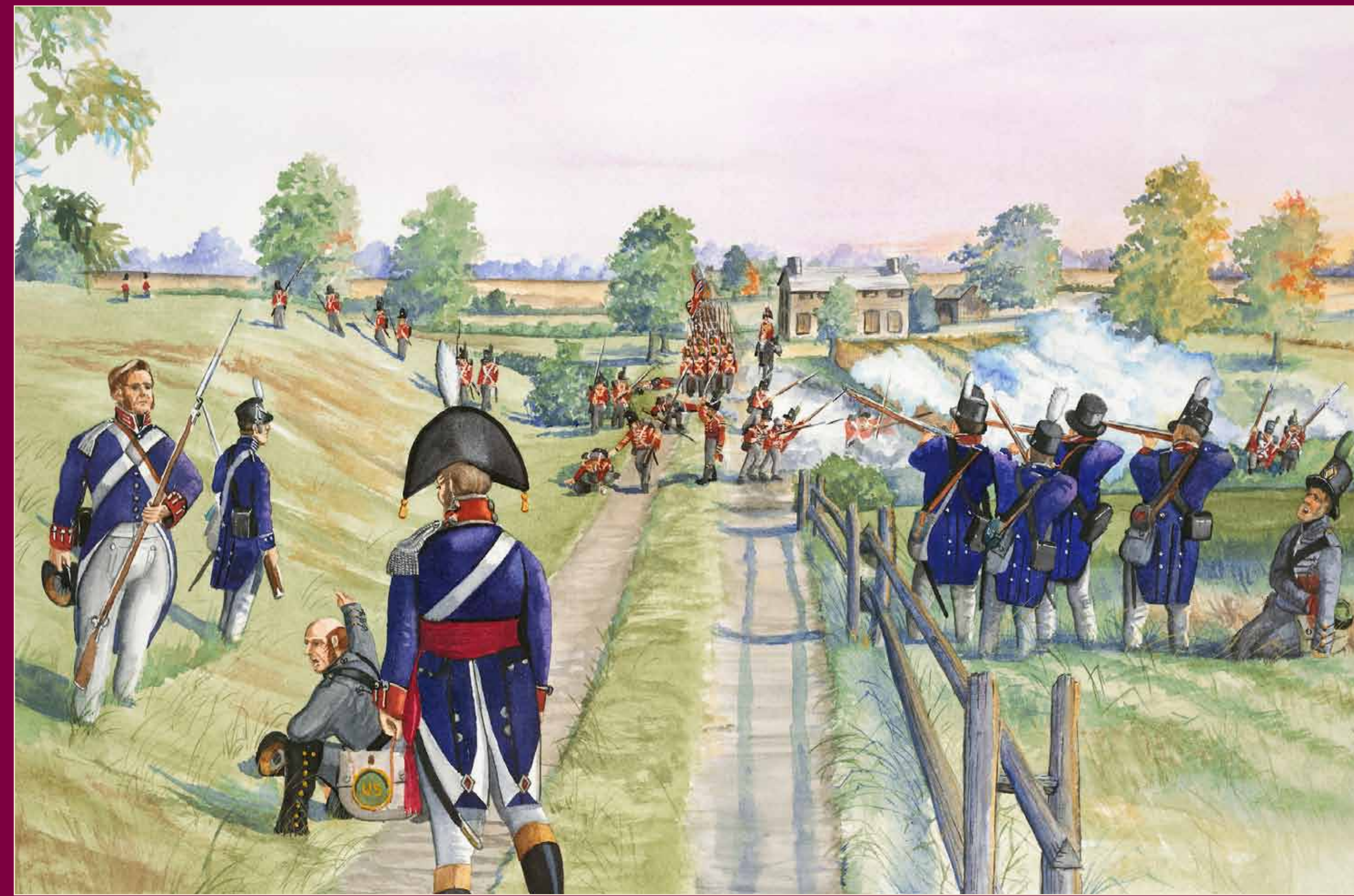
“The Clash at Culver Hill” - Artist rendition of the events at Culver Hill on September 6, 1814. Note the church in the background still stands.

Many of the wounded were brought to nearby buildings serving as temporary hospitals. The dead were temporarily buried in a garden at the foot of the hill. Although the British had won the day, their march southward took its toll. Today, the Culver Hill Memorial stands as a silent testament to the sacrifices made that day.