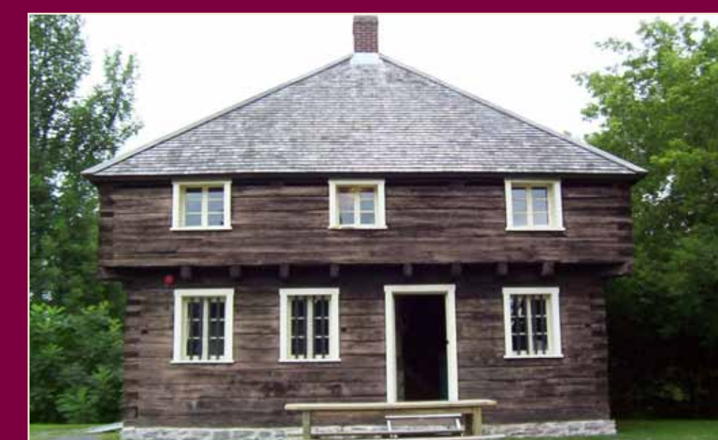
Bullet holes from the War of 1812 are still visible in the Lacolle Mills Blockhouse. Open to the public, it is located just over the border in Quebec on Route 223.