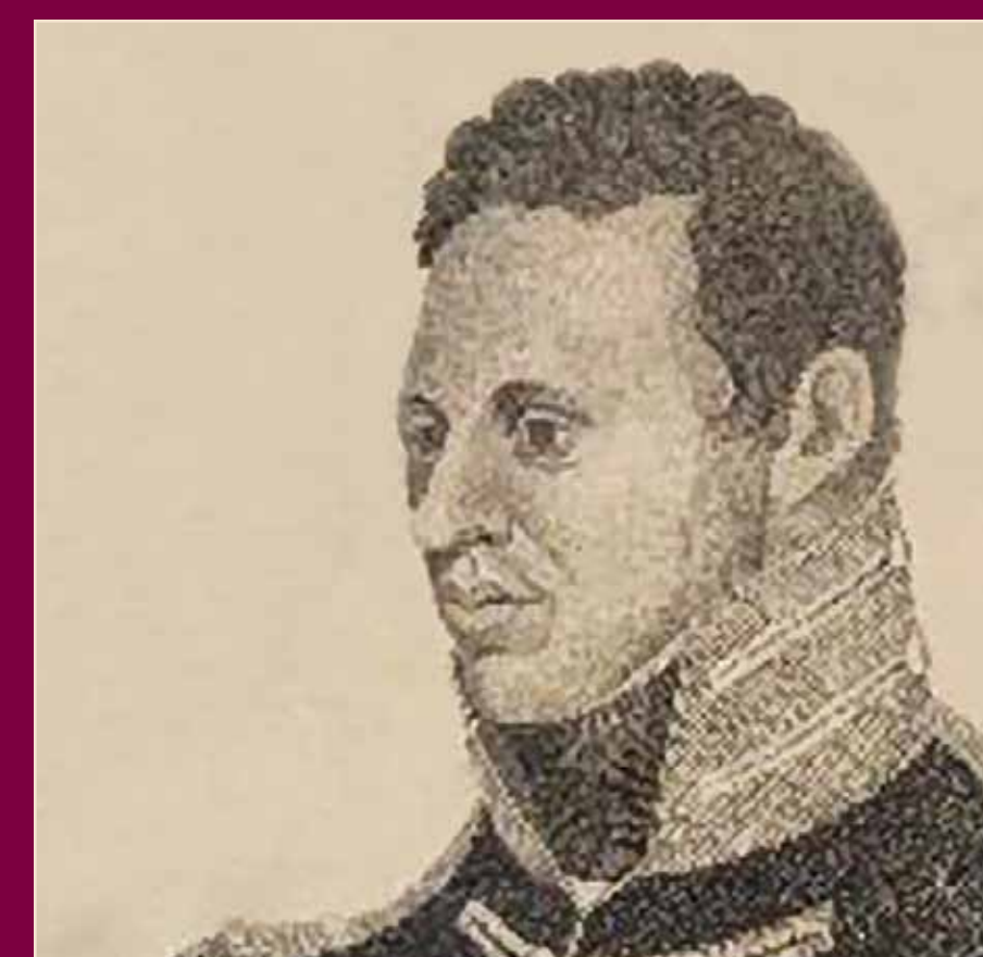
Colonel Zebulon Pike in 1813.